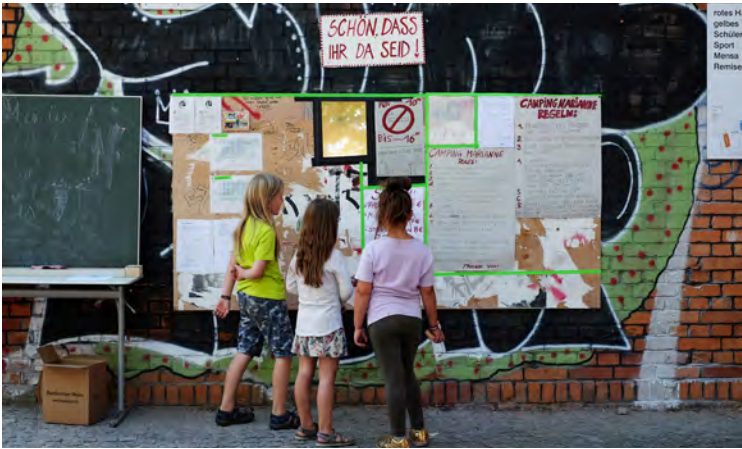
rotes H gelbes Schüler Sport Mama Rennise